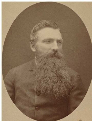
Fig. 1. Étienne Carjat, Portrait d'Auguste Rodin , 1879, photographie Ph. 148, Paris, Musée Rodin.

« Jean-Paul Laurens demeurait alors rue Notre-Dame des Champs [...]. Tous les mardis, il recevait, le soir, quelques amis. On y voyait Falguière qui égayait le cercle par sa grosse exubérance, par ses histoires du Midi, racontées d'une voix profonde. [...] Parfois, je voyais, dans un coin de l'atelier, appuyé à l'un des piliers de bois de l'estrade, un invité silencieux, qui restait là, immobile, et partait l'un des derniers, sans avoir dit quatre paroles. Au moment de prendre congé, il s'approchait de Mme Laurens et lui disait d'une voix zézayante : "Merci, madame, de la bonne petite soirée". Rien dans son costume ou son attitude ne révélait l'artiste, selon le type convenu. Une grande barbe rousse, des cheveux roux coupés ras, des yeux cachés derrière un éternel pince-nez, une redingote de notaire, tout indiquait, comme apparence, un homme de bureau. Il ne prenait aucune part, d'ailleurs, aux discussions artistiques qui sont la conversation perpétuelle des ateliers. Je demandai, un jour, à Laurens le nom de cet invité qui ne parlait pas. "Il s'appelle Rodin". Laurens ajouta : "C'est un sculpteur extraordinaire. Il fait mon buste: allez donc le voir" 1 . »