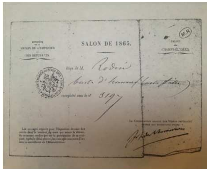
Fig. 6. Reçu de M. Rodin émanant du Ministère de la Maison de l'Empereur et des Beaux-Arts d'un buste d'homme en plâtre destiné au Salon de 1865 et enregistré sous le n° 9197. Paris, Archives du Musée Rodin.

Là encore, si Rodin présente fin mai 1864 le Buste du père Eymard pour être reçu membre de la SNBA, c'est que L'Homme au nez cassé n'est pas prêt. Il sera d'ailleurs refusé au Salon l'année suivante, comme l'atteste un récépissé de 1865 (fig. 6) conservé au Musée Rodin, concernant un « buste d'homme en plâtre ».