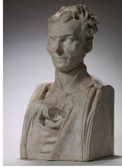
Fig. 3. Auguste RODIN Buste du Père Eymard , 1863, Plâtre, 59 x 29 x 29 cm. Inv. S. 1720, Paris, Musée Rodin.

La SNBA est un réseau riche en opportunités avec Barye et Carrier-Belleuse parmi les artistes fondateurs 52 . En juin 1864, le nom de Rodin apparaît en 1 ère page du Courrier Artistique :