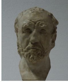
Fig. 5. Auguste RODIN, Buste de L'Homme au nez cassé , 1865, Inv. S. 1977, Paris, Musée Rodin.